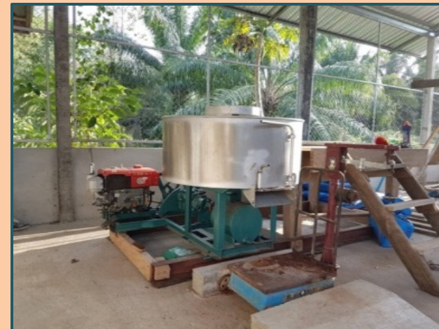
มีโรงผสมปุ๋ยเคมีไว้จำหน่ายแก่สมาชิกในชุมชน