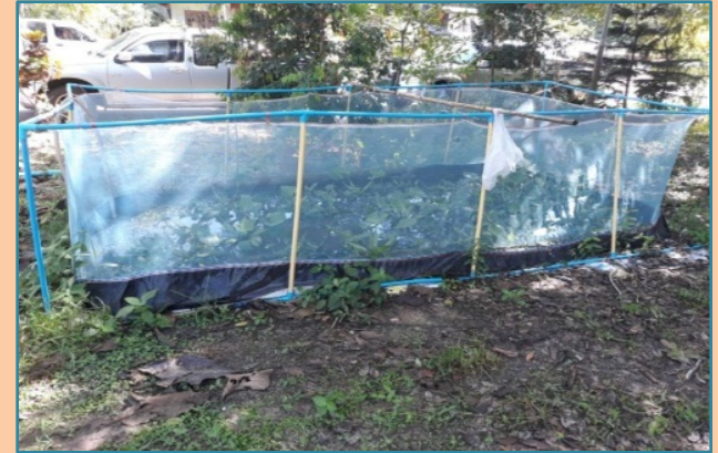
อาชีพการเลี้ยงปลาในกระชัง