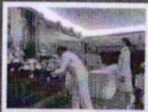
กิจกรรมถวายราชสดุดี พิธีถวายพานพุ่มดอกไม้ราชสักการะ ถวายราชสดุดีเนื่องในวันพ่อแห่งชาติ