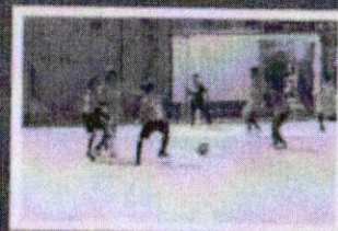
การป้องกันและแก้ไขปัญหายาเสพติด