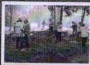
กิจกรรมบำเพ็ญ สาธารณประโยชน์