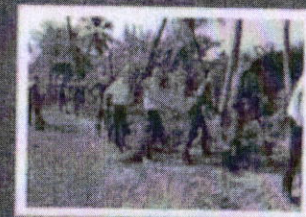
กิจกรรมการป้องกันและแก้ไข ปัญหายักยักพิบัติ