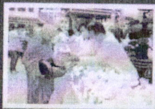
กิจกรรมพืธีทางศาสนา