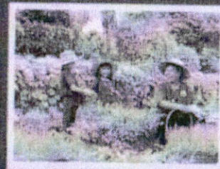
กิจกรรมการน้อมนำหลักปรัชญาของ เศรษฐกิจพอเพียงไปปฏิบัติ