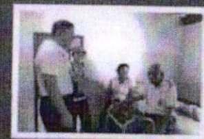
กิจกรรมการส่งเสริม ผู้ยากไร้