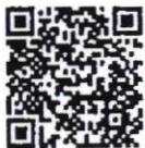
QR Code ใบสมัคร