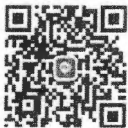
(โซน D อาคารโล่ง ศาลาประชาคม)