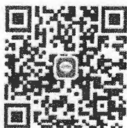
(โซน E ห้องแอร์ ศาลาประชาคม)