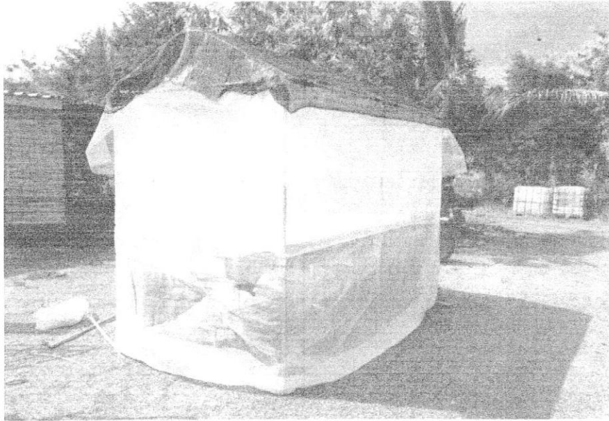
โรงเรือนปลูกผักไฮโดรโปนิคส์แบบมาตรฐาน พร้อมอุปกรณ์